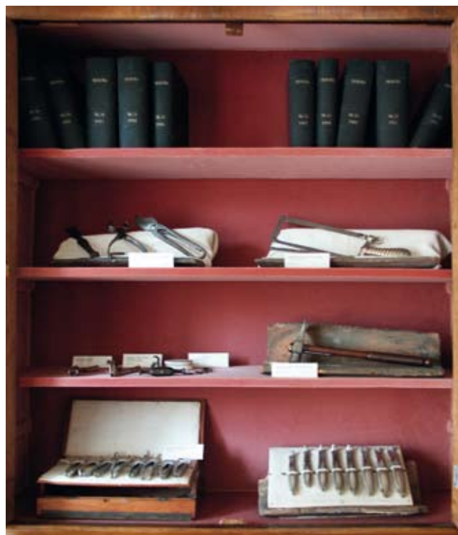
Strumentazione medica presso la Sala Golgiana dell'Istituto Camillo Golgi di Abbiategrasso.

18.00 - Andare a palazzo . Da campagna suburbana a città industriale: tracce di cambiamento nelle carte d'archivio . Incontro con Roberta Madoi e Giorgio Sassi alla Biblioteca Valvassori Peroni, Milano