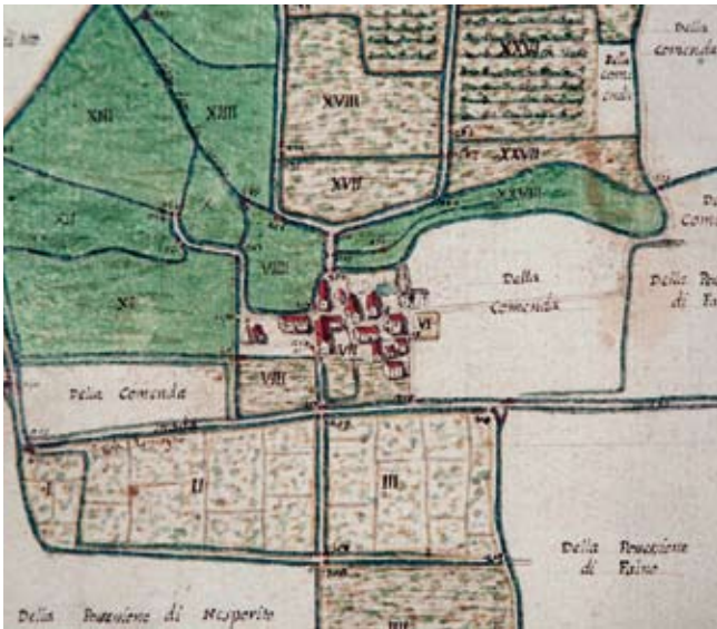
Attilio Arrigoni, Cabreo dei beni appartenenti al Luogo Pio della Misericordia, 1683, particolare con la Cascina Zunico.